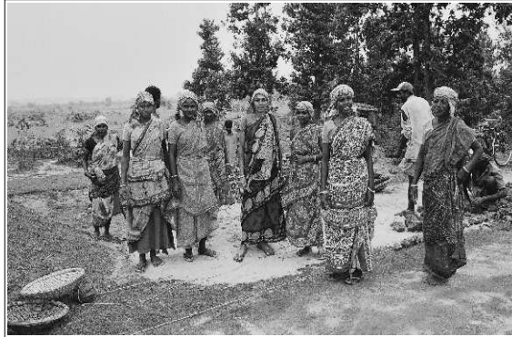
Schwere Arbeit im Straßenbau. Diese Frauen sind froh, ins Arbeitsbeschaffungsprogramm der Regierung aufgenommen worden zu sein.

Stolz legen mir die Frauen einer Selbsthilfegruppe (SHG) bei meinem Besuch im Dorf Bezda einen Stapel Papiere vor: Es ist ihr Dorfentwicklungsplan, den sie monatelang gemeinsam mit den Mitarbeitern unseres Partners Seva Kendra Calcutta (SKC) sowie dem Bürgermeister und Vertretern des Gemeinderats erarbeitet haben. Nach einer intensiven Dorfstudie vergeben sie Prioritäten für die identifizierten Probleme. An erster Stelle stehen die hohe Arbeitslosenquote, vor allem unter jungen Leuten, die schlechte Verbindung zur Außenwelt durch schlechte Straßen, der Mangel an sauberem Trinkwasser und die Bildungssituation. Die Lösung liegt auf der Hand: Das staatliche Arbeitsbeschaffungsprogramm, das Familien unterhalb der Armutsgrenze jährlich 100 Tage Arbeit zum gesetzlichen Mindestlohn garantiert, deckt verschiedene Infrastrukturmaßnahmen ab - Straßen- und Brunnenbau fallen darunter. Mit Unterstützung der Regierungsbeamten und der Projektmitarbeiter erstellen die Frauen einen umfassenden Dorfentwicklungsplan, den sie mit den anderen Dorfbewohnern diskutieren und abstimmen. Die Regierung bewilligt den Bau von 15 km