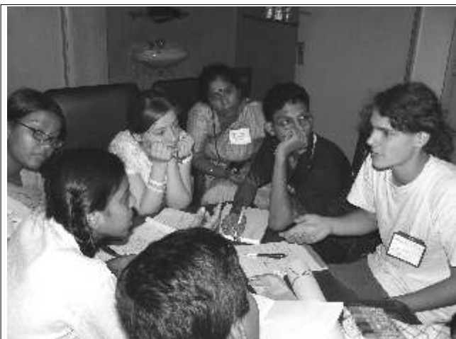
Schüler und Schülerinnen des Christoph Probst Gymnasiums Gilching und der Chatra High School überlegen in einer gemeinsamen Arbeitsgruppe, welchen Beitrag die Partnerschulen gemeinsam gegen Kinderarbeit leisten können. Geplant ist u.a. ein Schul-Theaterstück auf der Basis von wirklichen Lebensgeschichten aus Chatra.