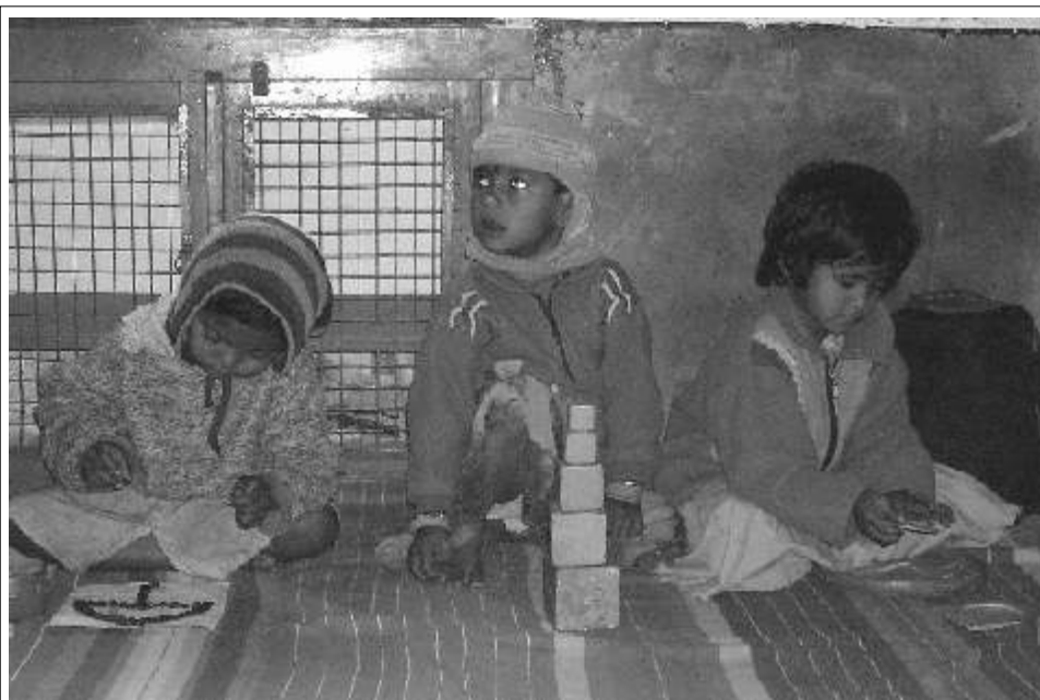
Konzentriert arbeiten die kleinen Mädchen mit ihren low-cost Montessori-Materialien