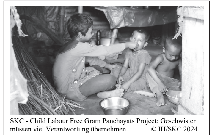
SKC - Child Labour Free Gram Panchayats Project: Geschwister müssen viel Verantwortung übernehmen.

Mütter während der Schwangerschaft) deutet dies auch auf einen schlechten Zugang zu Gesundheits-, Trinkwasser- und Sanitärversorgung hin. Die Armut vieler Familien führt dazu, dass Kinder sich bereits vor der Geburt verzögert entwickeln, bleibende geistige und körperliche Schäden davontragen und mit hoher Wahrscheinlichkeit ebenfalls in Armut leben werden.