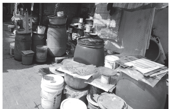
Lake Gardens: Kolkata-Slum: fließend Wasser gibt es nur für zwei Stunden am Tag. Alle Behälter müssen gefüllt werden.

über 92 Millionen Einwohnern in Westbengalen – mehr als in Deutschland – ist die Summe pro Kopf mit 67 Cent zwar nur gering, doch trotzdem ist dies eine wichtige Maßnahme des indischen Staates, die Unternehmen in die Verantwortung für das Allgemeinwohl der Gesellschaft zu nehmen. Es gibt staatliche Richtlinien, welche Maßnahmen im Rahmen der CSR durchgeführt werden können, doch die Auswahl der Projekte und des Projektgebiets liegt beim Unternehmen. Ein Kritikpunkt hieran ist die Konzentration der Projekte auf gut erreichbare Gebiete mit aktiven und gut organisierten Strukturen. Entlegene schwer zugängliche Gebiete (z.B. das Adivasi-Gebiet im Jhargram-Distrikt unseres Partners KJKS) mit nur wenigen zivilgesellschaftlichen Initiativen, wie aktiven Frauen- und Gemeindegruppen und lokalen Nicht-Regierungsorganisationen, profitieren deutlich weniger von den CSR-Geldern.