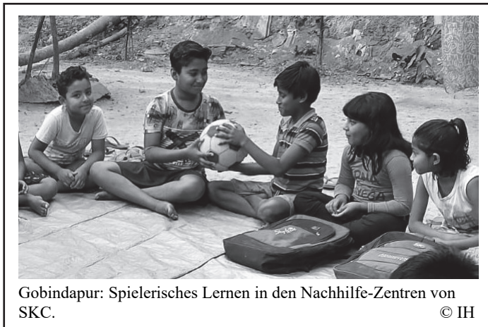
Gobindapur: Spielerisches Lernen in den Nachhilfe-Zentren von SKC.